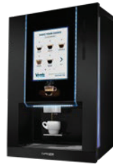
CAFFÈUNO ESPRESSO semiautomatic TSE