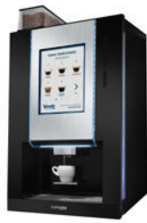
CAFFÈUNO "PRO" ESPRESSO mit Bohnglas semiautomatic TSC