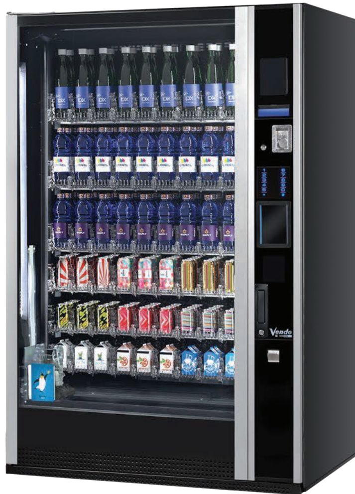
G-Drink Design 9 Vertical