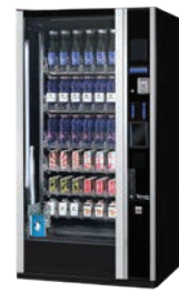
G-DRINK 6 DESIGN DC6