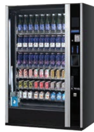
G-DRINK 9 DESIGN DV9