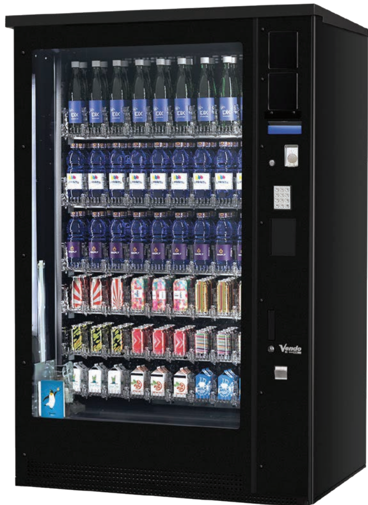
G-Drink DM 9 OD Vertical Outdoor