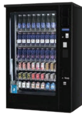
G-DRINK 9 OUTDOOR DM9 OD