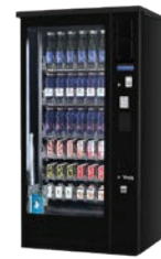
G-DRINK 6 OUTDOOR DM6 OD