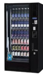
G-DRINK 6 STANDARD DM6