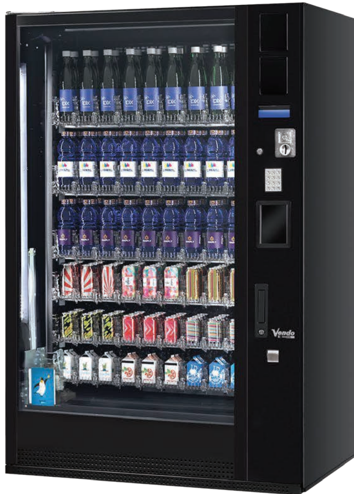
G-Drink DM 9 Vertical