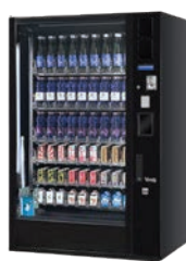
G-DRINK 9 STANDARD DM9