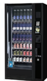
G-DRINK 6 TOUCH DT6