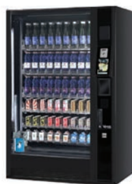
G-DRINK 9 TOUCH DT9