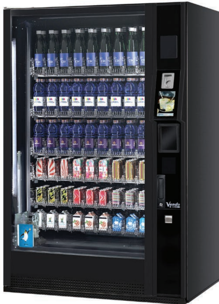
G-Drink 9 Vertical Touch