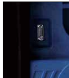
Mikro-USB Port für schnelle Updates mittels USB-Stick