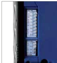
Dip-Switch für die Auswahl der zu akzeptierenden Banknoten