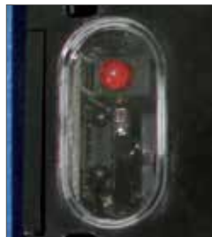
IrDA Port für Firmware-Update